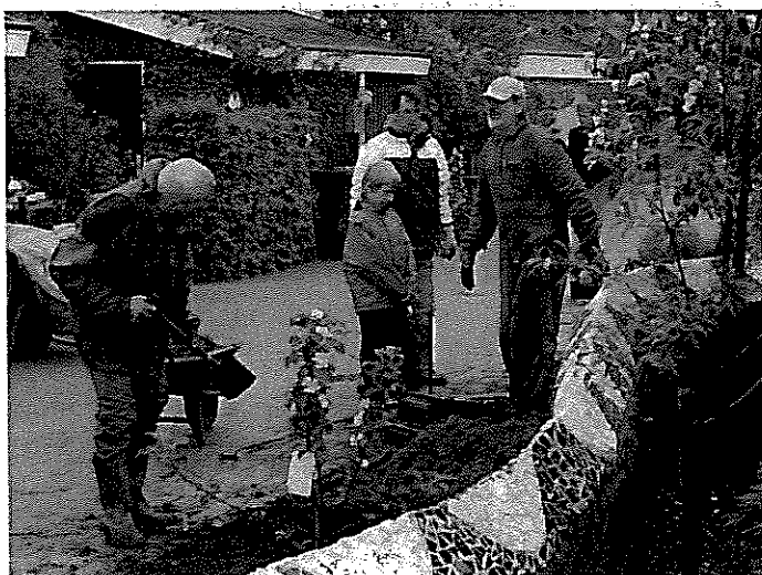
Samen krappen bewoners een groenstrook op.

Tot slot hebben ook de gemeente, een professionele hovenier en de eergenoemde aangestelde coördinator bijgedragen aan het succes van de wijk. Zij boden begeleiding, advies en specialistische kennis. De gemeente heeft daarnaast van begin af aan ingezet op een succesvolle