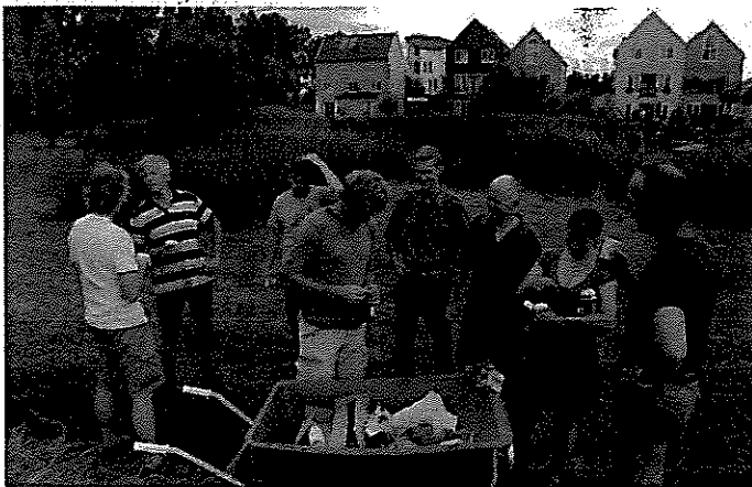
Na afloop van het hooien is het tijd voor een borrel.