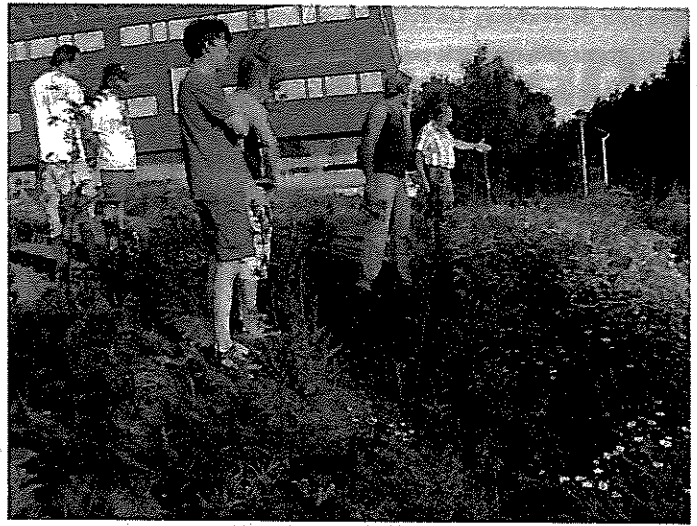
Bewoners en gemeente beoordelen het groen met een schouw.

EVA-Lanxmeer lijkt een sprookje voor de bewoners én overheid. Veel van de doelen van EVA-Lanxmeer zijn behaald: zowel in technische als sociale zin is EVA-Lanxmeer een duurzame wijk. Maar er zijn ook kanttekeningen. Het is niet altijd vanzelfsprekend dat gemeenschappelijke belangen overeenstemmen met privébelangen, bijvoorbeeld als bewoners meer privacy willen dan wat de natuurlijke tuinafscheiding van de privétuin hun biedt en daarom een schutting plaatsen. Er samen uit proberen te komen door middel van overleg en onderhandeling is dan de vervolgstap. Desnoods plant Terra Bella een haag tegen de schutting. Dit soort strijd komt slechts af en toe voor, en in geen enkel geval loopt het uit de hand. "Wij zitten in een organisatie-model waarin