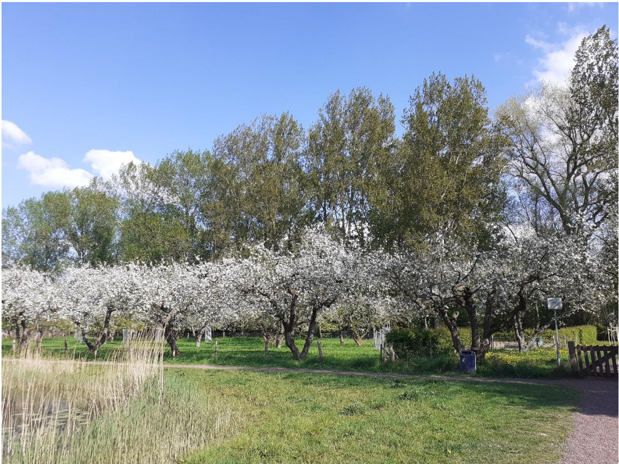
De gemeenschappelijk onderhouden boomgaard in de wijk Lanxmeer in Culemborg (auteur, 2022)